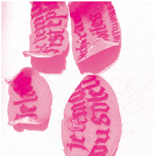
Tasnine Sallam Performance