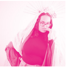
Eva Pamart Performance